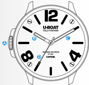
Immagine indicativa. Alcuni componenti possono non essere presenti o presenti in diversa posizione.