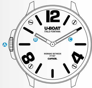
Immagine indicativa. Alcuni componenti possono non essere presenti o presenti in diversa posizione.