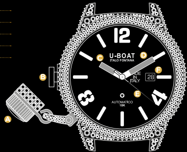
Immagine indicativa. Alcuni componenti possono non essere presenti o presenti in diversa posizione.