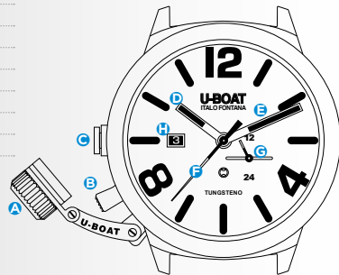
Immagine indicativa. Alcuni componenti possono non essere presenti o presenti in diversa posizione.