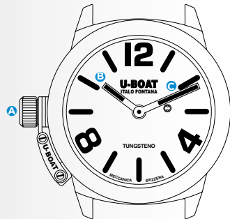
Immagine indicativa. Alcuni componenti possono non essere presenti o presenti in diversa posizione.