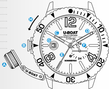
Immagine indicativa. Alcuni componenti possono non essere presenti o presenti in diversa posizione.