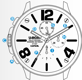
Immagine indicativa. Alcuni componenti possono non essere presenti o presenti in diversa posizione.