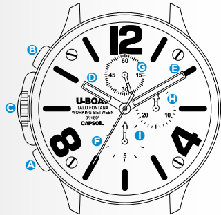
Immagine indicativa. Alcuni componenti possono non essere presenti o presenti in diversa posizione.