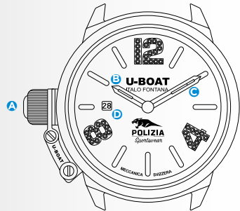
Immagine indicativa. Alcuni componenti possono non essere presenti o presenti in diversa posizione.