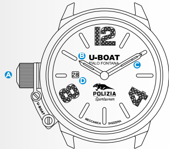
Immagine indicativa. Alcuni componenti possono non essere presenti o presenti in diversa posizione.