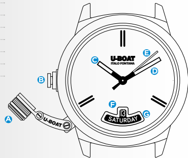
Immagine indicativa. Alcuni componenti possono non essere presenti o presenti in diversa posizione.