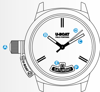
Immagine indicativa. Alcuni componenti possono non essere presenti o presenti in diversa posizione.