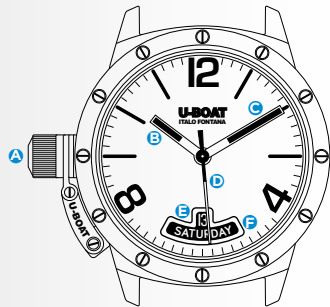
Immagine indicativa. Alcuni componenti possono non essere presenti o presenti in diversa posizione.