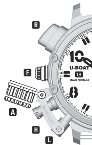
POSIZIONE 1 POSIZIONE NEUTRA