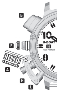
POSIZIONE 2 PRIMO SCATTO