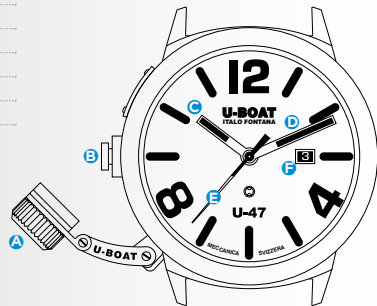
Immagine indicativa. Alcuni componenti possono non essere presenti o presenti in diversa posizione.