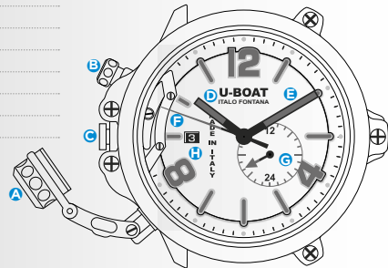
Immagine indicativa. Alcuni componenti possono non essere presenti o presenti in diversa posizione.