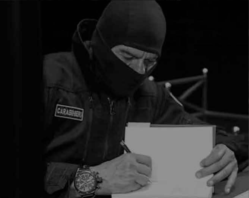
ITALIAN ARMY 9TH PARACHUTE ASSAULT REGIMENT "COL MOSCHIN"