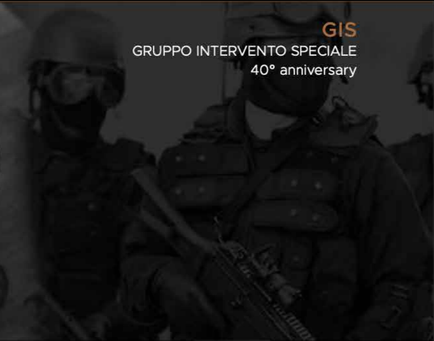
GIS GRUPPO INTERVENTO SPECIALE 40° anniversary