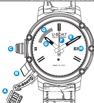
Immagine indicativa. Alcuni componenti possono non essere presenti o presenti in diversa posizione.