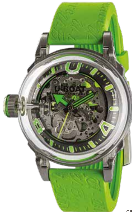
A SINISTRA U-65 Automatic cal. Miyota 8N24 Skeleton

L'idea dell'Oil Immersion nasce dalla mia passione per creare qualcosa di unico, ispirandomi a ciò che vedo intorno a me. Guardando una bussola sulla barca, sono rimasto affascinato dal suo aspetto: il nero assoluto, il movimento fluido delle lancette. Ho voluto un orologio che desse la stessa emozione. Con l'olio all'interno e uno zaffiro leggermente bombato, il quadrante