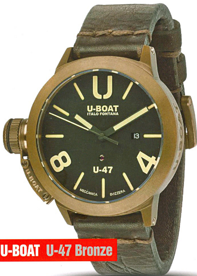
U-BOAT U-47 Bronze